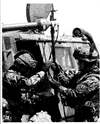
Soldati italiani in Afghanistan

Bomba-trappola a Herat uccisi due soldati italiani