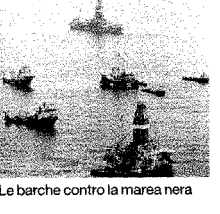
Le barche contro la marea nera

dal nostro inviato ANGELO AQUARO NEW YORK IL centesimo giorno la macchia sparisce. Se fosse una favola non si sarebbe potuto trovare finale migliore per la vicenda del petrolio disperso nel Golfo del Messico, dalla Louisiana alla Florida. SEGUE A PAGINA 15