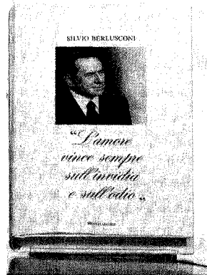
all'indomani dell'aggressione subita in piazza