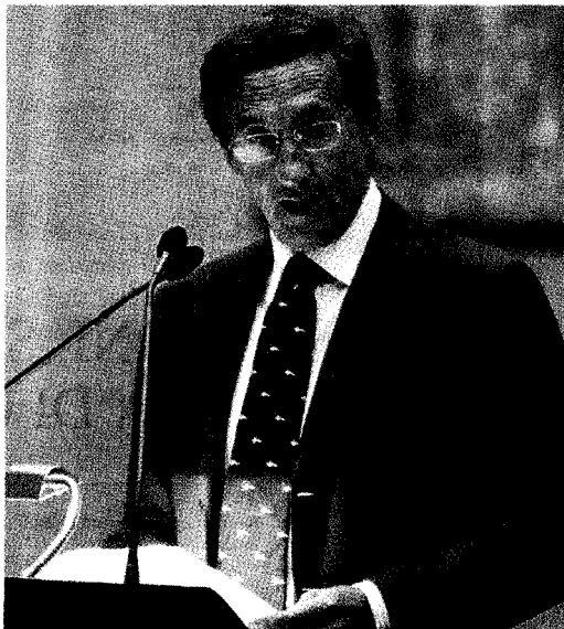
Fini interverrà domani all'incontro nazionale di studi delle Acli