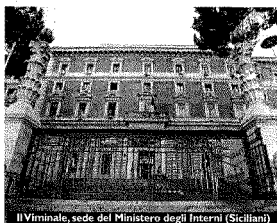
Il Viminale, sede del Ministero degli Interni (Siciliani)