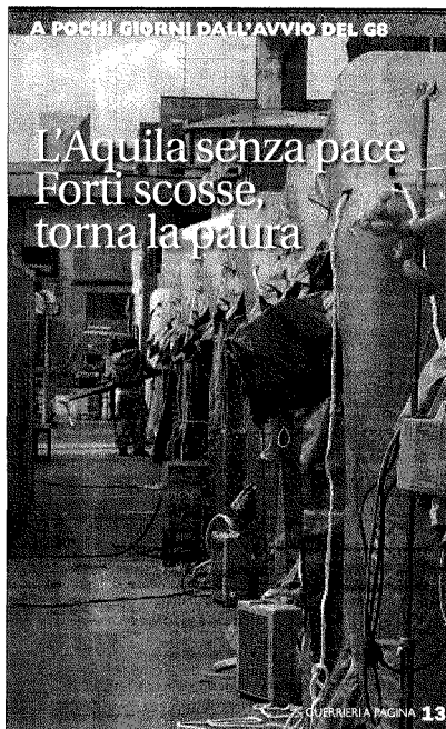
A POCCHI GIORNI DALL'AVVIO DEL G8

L'Aquila senza pace Forti scosse, torna la paura