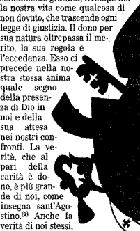
NON TUTTO È MERCATO

35. Il mercato, se c'è fiducia reciproca e generalizzata, è l'istituzione economica che permette l'incontro tra le persone, in quanto operatori economici che utilizzano il contratto come regola dei loro rapporti e che scambiano beni e servizi tra loro per soddisfare i loro bisogni e desideri. Il mercato è soggetto ai principi della cosiddetta giustizia commutativa, che regola appunto i rapporti del dare e del ricevere tra soggetti paritetici. Ma la dottrina sociale della Chiesa non ha mai smesso di porre in evidenza l'importanza della giustizia distributiva e della giustizia sociale per la stessa economia di mercato, non solo perché inserita nelle maglie di un contesto sociale e politico più vasto, ma anche per la trama delle relazioni in cui si realizza. Infatti il mercato, lasciato al suo principio dell'equivalenza di valore dei beni scambiati, non riesce a produrre quella coesione sociale di cui pure ha bisogno per ben funzionare. Senza forme interne di solidarietà e di fiducia reciproca, mercato non può pienamente esprimere la propria funzione economica. Ed è qui che la fiducia che è venuta a mancare, e la perdita della fiducia è una perdita grave. Opportunamente Paolo VI nella Po-