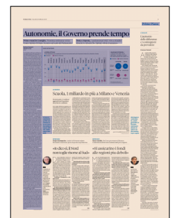
Peso: 1-7%, 3-29%